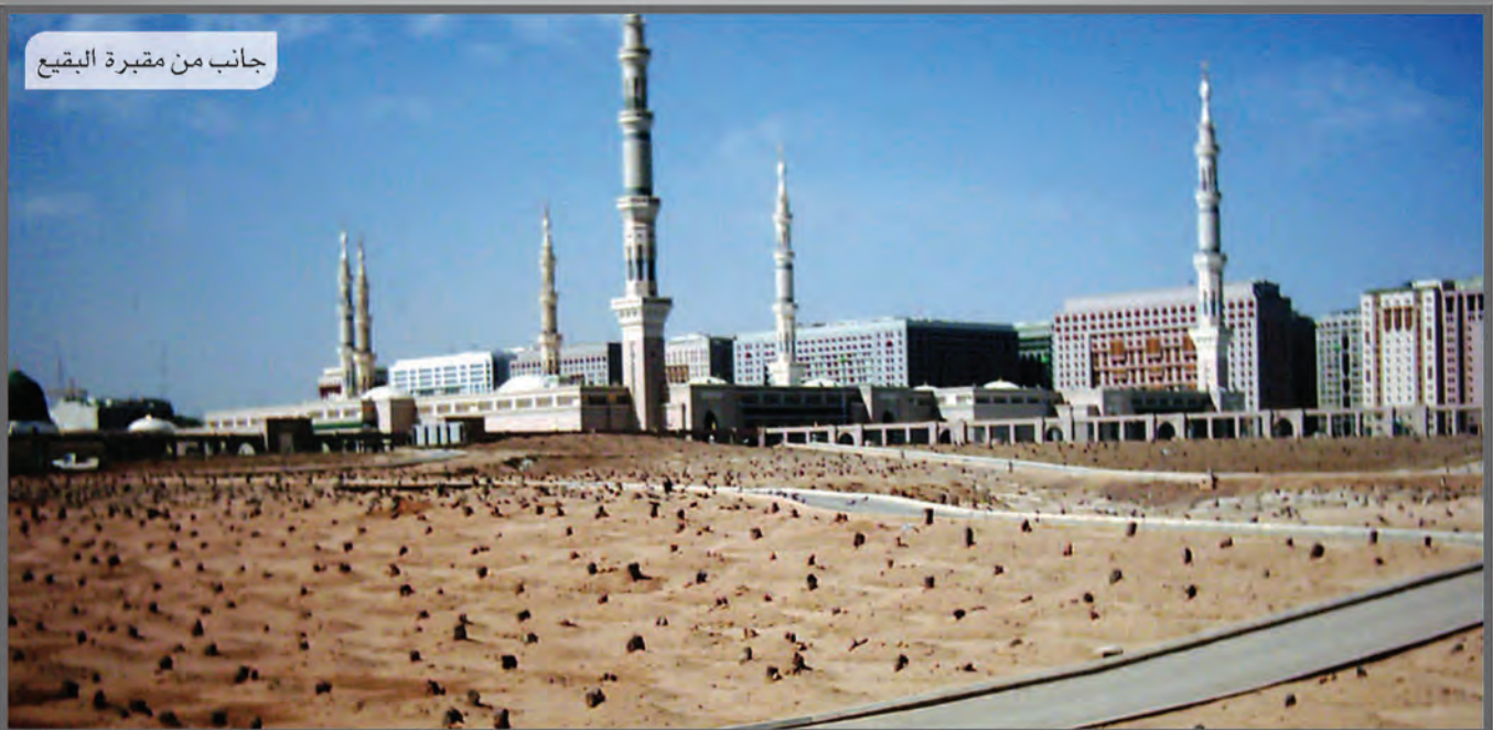
جانب من مقبرة البقيع