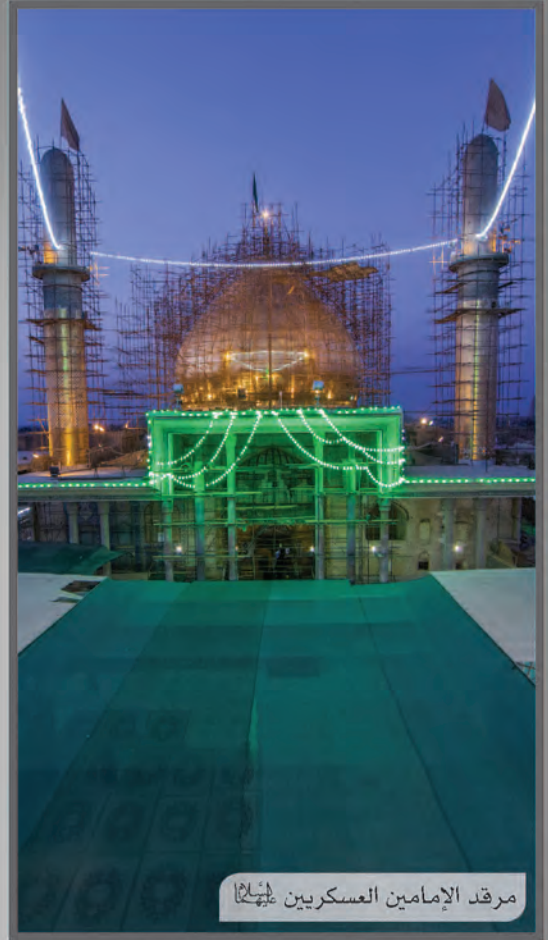
مرقد الإمامين العسكريين عليهما السلام