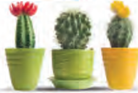
١. النباتات الصبارية

يتصدر اللبلاب الإنكليزي قائمة NASA كأكثر النباتات المنزلية فائدة بسبب قدراته الهائلة على تصفية الهواء.. وهو أكثر النباتات المنزلية فعالية بامتصاص غازات الفورمالدهيد المسرطنة.. إضافة لكونه نباتاً سهل النمو والتكيف في مختلف الظروف.. يمكننا تعليقه أو وضعه على الأرض.. يزدهر هذا النبات بدرجات الحرارة المعتدلة وأشعة الشمس المتوسطة..