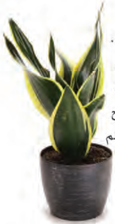
٤. لسان الحماة

إضافة لخواص النباتات الصبارية في تسكين الحروق الشمسية ولسعات الحشرات والجروح.. تتمتع أيضاً بالقدرة على إزالة السموم من جسمنا.. وبيتنا.. يمكن للنباتات الصبارية تنقية الهواء من الملوثات الموجودة في مستحضرات التنظيف الكيماوية.. ومن الأشياء الجميلة المميزة في هذه النباتات ظهور البقع البنية على أوراقها عندما تزيد كمية المواد السامة الموجودة بالهواء..