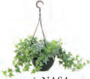
٢. اللبلاب الإنكليزي

يتصدر اللبلاب الإنكليزي قائمة NASA كأكثر النباتات المنزلية فائدة بسبب قدراته الهائلة على تصفية الهواء.. وهو أكثر النباتات المنزلية فعالية بامتصاص غازات الفورمالدهيد المسرطنة.. إضافة لكونه نباتاً سهل النمو والتكيف في مختلف الظروف.. يمكننا تعليقه أو وضعه على الأرض.. يزدهر هذا النبات بدرجات الحرارة المعتدلة وأشعة الشمس المتوسطة..