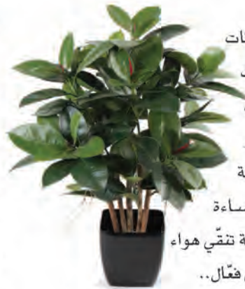
٣. شجرة المطاط

هي نبتة رائعة ساحرة لتزيين زوايا بيتنا.. يمكن لهذه النبتة أن تنمو وتزدهر بالقليل من الضوء والماء.. كما أنّها فعّالة جداً في امتصاص غاز ثاني أكسيد الكربون وطرح غاز الأوكسيجين خلال الليل بخلاف معظم النباتات الأخرى التي تقوم بهذا نهاراً.. لهذا وجودها في غرفة نومنا يساعدنا على النوم الهادئ الهانئ..