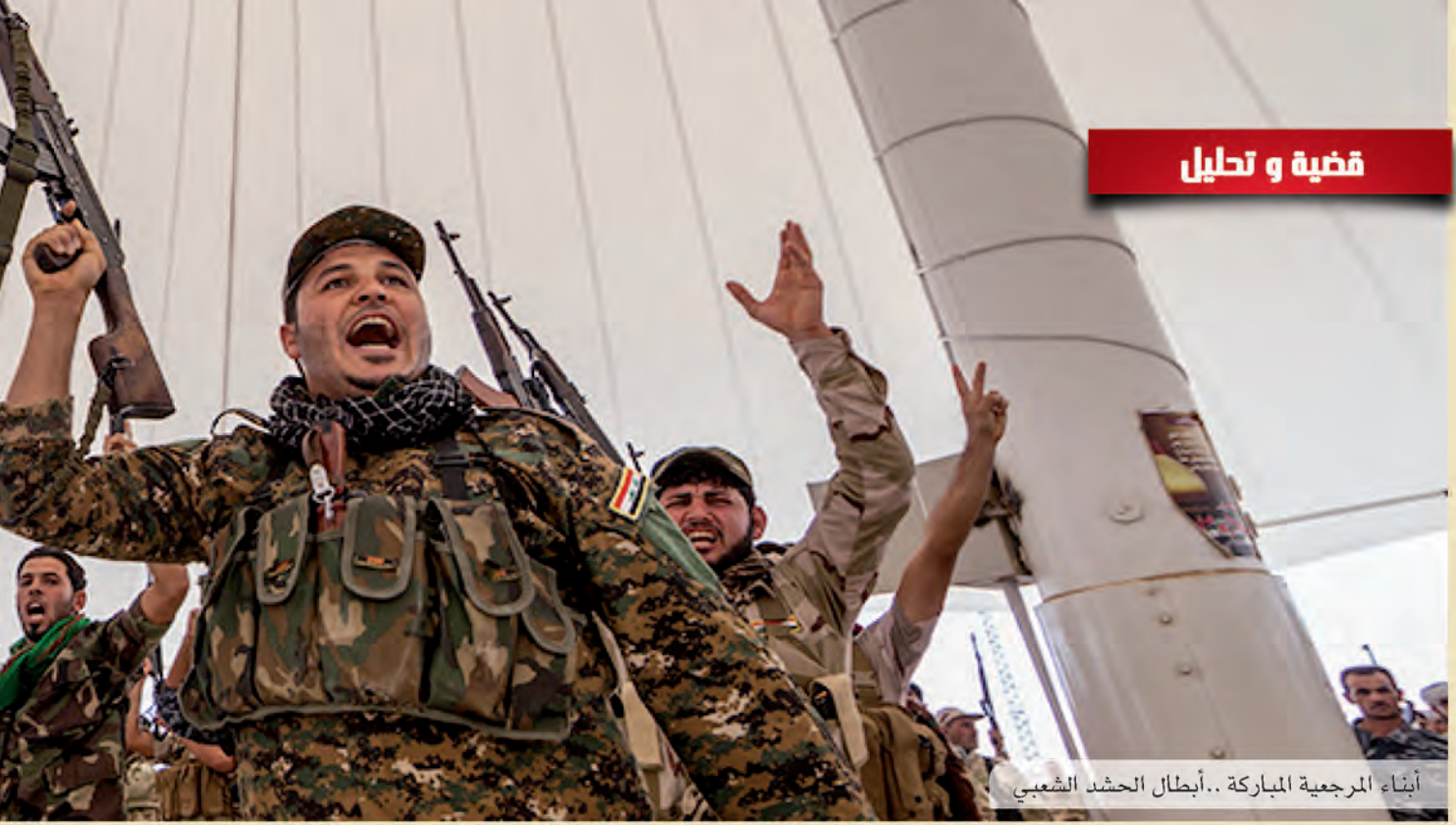
أبناء المرجعية المباركة.. أبطال الحشد الشعبي

يُشكروا، وإن فشلوا. ولو بسبب تصرف تلك الحكومات وسوء تدبيرها. تحملوا تبعه الفشل، وربما انتصر العدو فشنى منهم غيظه، وانتقم لموقفهم منه.