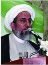
الشيخ: حبيب الكاظمي

..والمسيطر - في النهاية - على ذلك المركز الخطير في الوجود ، هو الذي يتحكم أخيراً في حركات العبد وسكناته وقد عبّر الإمام الصادق (عليه السلام) عن ذلك الجهاز المسيطر بقوله: {به يعقل ويفقه ويفهم ، وهو أمير بدنه الذي لا يرد الجوارح ولا يصدر إلا عن رأيه وأمره}.. فالمشتغل بتهذيب الظاهر مع إهمال الباطن ، كمن يريد إدارة الحكم و شؤون القصر بيد غيره وقد ورد عن أمير المؤمنين (عليه السلام) ما يصور هذه المعركة الكبرى القائمة بين هذين المعسكرين في عالم الوجود ، وذلك بقوله في دعاء الصباح: {وإن خذلني نصرك عند محاربة النفس والشيطان ، فقد وكلني خذلانك إلى حيث النصب والحرمان} .