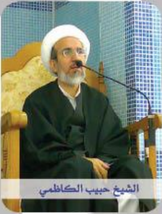
الشيخ حبيب الكاظمي

إن لمأساة الإمام الحسين عليه السلام وقعاً متميزاً سواء في حياة الأنبياء السلف، أو بالنسبة إلى خاتم الأنبياء و ذريته. و مقارنة إجمالية بين حالة الإمام عليه السلام في يوم عرفة ( بنعائه) المتميز و بين حالته في يوم عاشوراء (بأحداثه) الثقيلة تبين شيء من عظمة الكارثة و كيف إنه عز على رب العالمين أن يُعامل أعرف أهل زمانه بالله عز وجل هذه معاملة التي لم يشهد لها التاريخ مثلاً. و من هنا كان الارتباط به من خلال إحياء ذكره و التأثر بمصابه و من أعظم سبل نيل رضا الرب بما لا يخطر على العقول إذ إن عظمة المأساة مما لم تخطر على الأذهان..