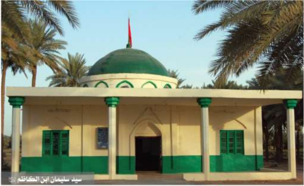
سيد سليمان ابن الكاظم