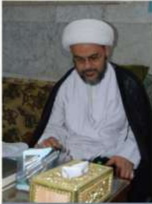
الشيخ صلاح الخفاجي