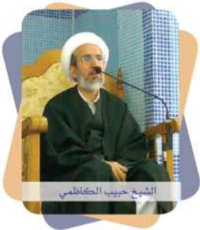
الشيخ حبيب الكاظمي

(السجدة: ١٦)، فإنه سيوفر على نفسه - ساعات كثيرة - فيما هو خير له وأيقن.. وقد روي عن أمير المؤمنين عليه السلام أنه قال: «من كثر في ليله نومه، فاته من العمل ما لا يستدركه في يومه». «وبش الغريم النوم، ويفني قصير العمر، ويقوت كثير الأجر».