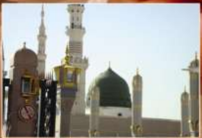
المسجد النبوي الشريف