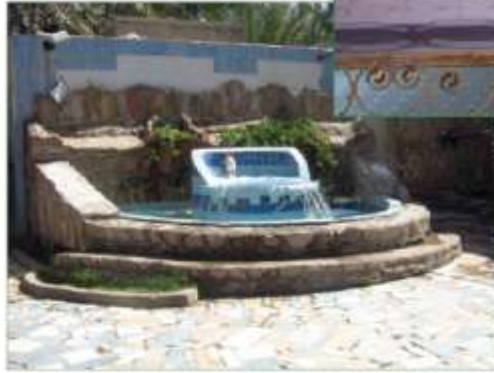
أجرت التحقيق: ليلى إبراهيم الهر

الإمام الحسن بن علي بن أبي طالب عليه السلام وابن سيدة نساء العالمين عليها السلام حفيد الرسول الأكرم صلى الله عليه وآله يلقب بكريم أهل البيت عليهم السلام حيث كانت له هيبته الملوك وصفات الأنبياء ووقار الأوصياء. وكان من أشبه الناس برسول الله صلى الله عليه وآله وكان يبسط له على باب داره يساطا يجلس عليه مع وجهاء وكبار الأمة فإذا خرج وجلس انقطع الطريق. فما يمر من ذلك الطريق أحد إجلالاً للإمام الحسن عليه السلام .