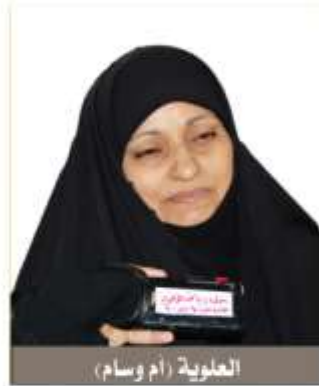
الهلوية (أم وسام)

شهر رمضان خاصة تختلف عن غيره من الشهور فكل شيء فيه له معنى معين، ليله ونهاره، صباحه ومساءه، فطوره وسجوره. وهو يمثل علينا بكل بركاته وفيوضاته الربانية وأحواله الروحانية، وأوقاته تكون ذهبية فهي فرصة لمراجعة النفس واعادتها إلى حظيرة القدس الإلهية...ولكن هناك من يضيع هذه الفرصة الثمينة وهو في هذا الشهر المبارك من خلال ملاسقته للتلفاز ليلاً نهاراً وكان هذا الشهر قد خصص لتابعة سباق المسلسلات التي تعرضها الفضائيات مبتدئين بذلك عن فيوضاته وإدراكه علة سومه وخصوصيته عن باقي الشهور