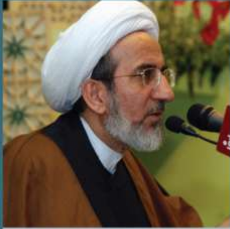
الشيخ حبيب الكاظمي