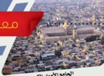
الجامع الأموي الكبير