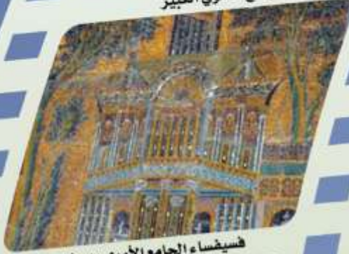
فسيفساء الجامع الأموي بدمشق