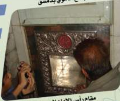
مقام رأس الإمام الحسين