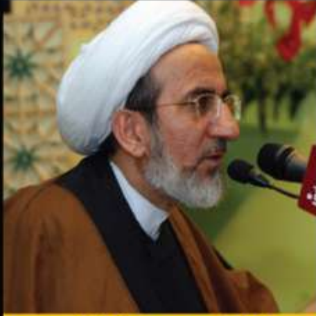
الشيخ حبيب الكاظمي