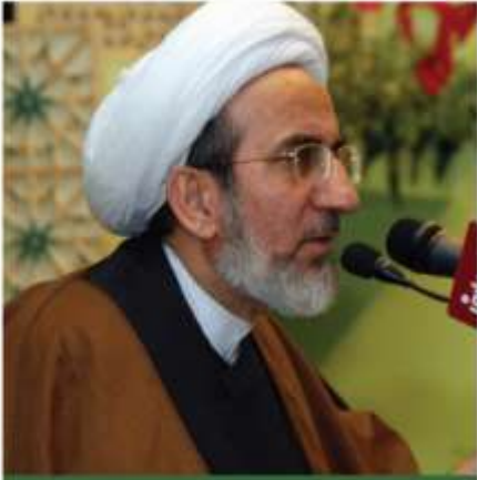
الشيخ حبيب الكاظمي