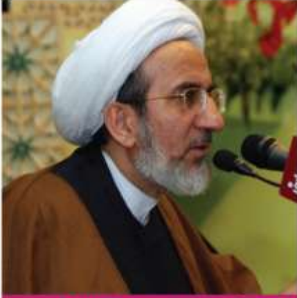
الشيخ حبيب الكاظمي