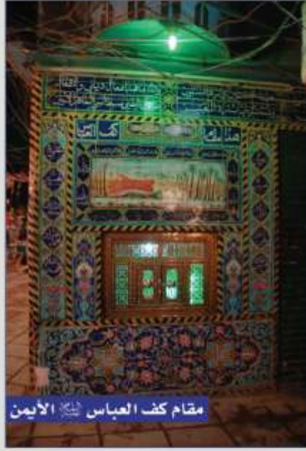
مقام كف العباس عليه السلام الأيمن

نحن نطمح أن يكون هكذا ولكن لا نجزم به فالقضية منطوية بالأخ المصمم.