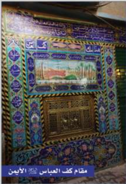
مقام كف العباس عليه السلام الأيمن

استحقت كفي أبي الفضل العباس عليه السلام بجدارة أن تحمل القداسة وتسمو في سماء التضحيات لتكونا نجمين لامعين قطعنا من أجل إحياء الدين الإسلامي وإعلاء رايته التي حملها، كانت هاتان الكفان وما زالتا يفيضان ويفدقان على الناس الخيرات والبركات ويفضلها عمت الفيوضات الإلهية على أرض الإباء، هذه سيرتهم في كل مكان يحلون به، تصيح تلك الأرض مباركة وأهنة الناس تهوى إليها، فضلهم عم على كل البشرية فهم الوسيلة إلى الله عز وجل ويفضل دمائهم التي سالت على رمضاء كربلاء أصبحت كربلاء قبلة الأنظار.