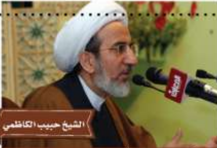
الشيخ حبيب الكاظمي