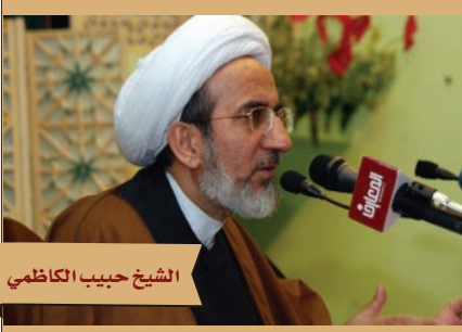
الشيخ حبيب الكاظمي