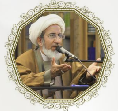
الشيخ صيب الكاظمي