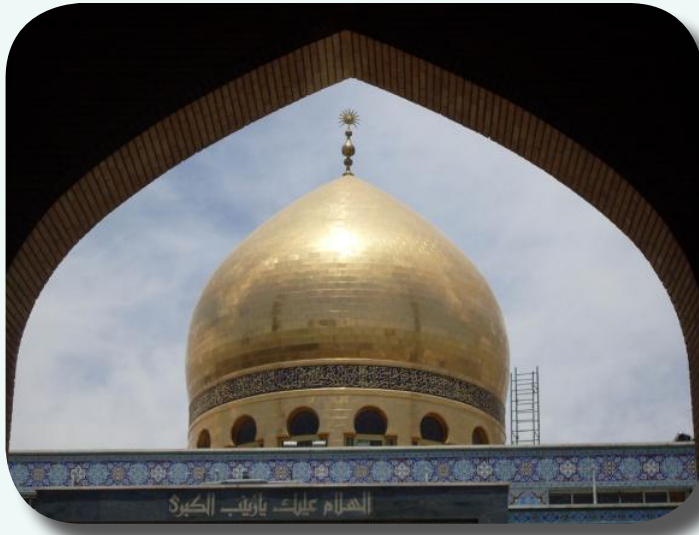
الهلام عليك يا زينب الكبرى

اتصلت يوم الأحد ليلاً -ليلة الاثنين ٧ رجب- بعد أن