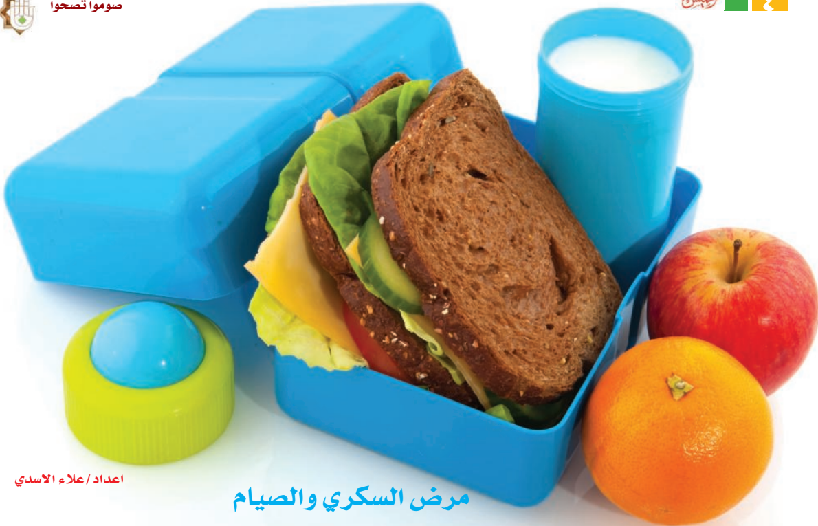
اعداد/ علاء الاسدي