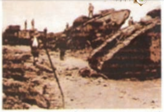
أثناء الحفريات في الحرب العالمية الأولى وجدوا لوح سليمان ١٩١٦م

لم يتمكن القائد الجري (ابن كريندل) الذي نُقل إليه اللوح من فهم ما كُتب عليه، كونه بلغة أجنبية قديمة.