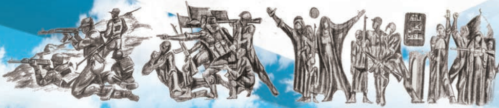
النصب التذكري الفائزة بالمركز الاول في مسابقة مهرجان فتوى الدفاع المقدسة الثقافي

أعلنت اللجنة التحضيرية الخاصة بمهرجان فتوى الدفاع المقدسة الثقافي السادس عن موعد انطلاق فعاليات المهرجان الذي يقيمه قسم الشؤون الفكرية والثقافية، بالتعاون مع مؤسسة الوافي للتوثيق والدراسات في العتبة العباسية المقدسة، احتفاءً واستذكراً للذكرى السنوية لانطلاق فتوى الدفاع المقدسة وتحت شعار: (المرجعية الدينية حصن الأمة الإسلامية) وذلك في المدة من ١٦ - ١٧ ذي القعدة / ١٤٤٣هـ، الموافق لـ ١٦ - ١٧ حزيران / ٢٠٢٢م. على قاعة الإمام الحسن (عليه السلام) في تمام الساعة العاشرة صباحاً، ويتضمن المهرجان المسابقات الآتية: